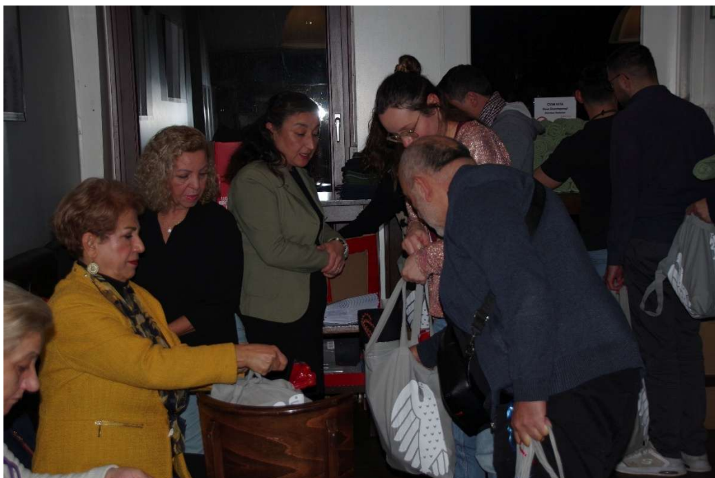
Die Weihnachtspäckchen für obdachlose Menschen werden verpackt