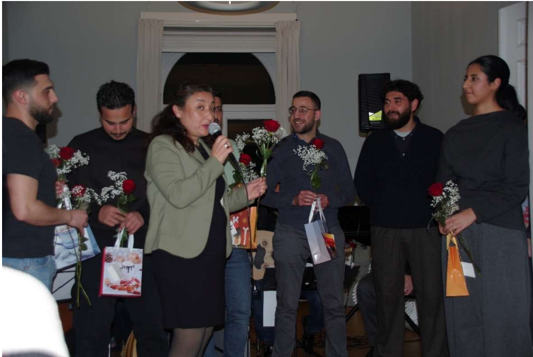
Hanifah dankt dem Organisations- und Veranstaltungsteam